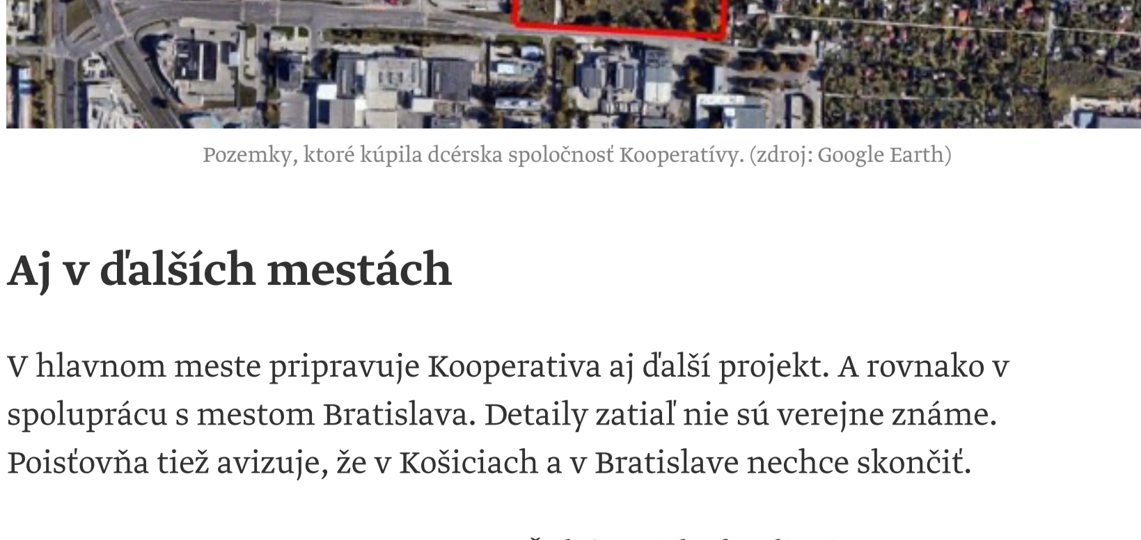
Pozemky, ktoré kúpila dcérska spoločnosť Kooperatívy.

Projekt chce Kooperativa realizovať s podporou mesta Bratislava a mestskej časti Ružinov. Keďže magistrát sa snaží podporovať nájomné bývanie, je možné, že projekt získa zmenu územného plánu.