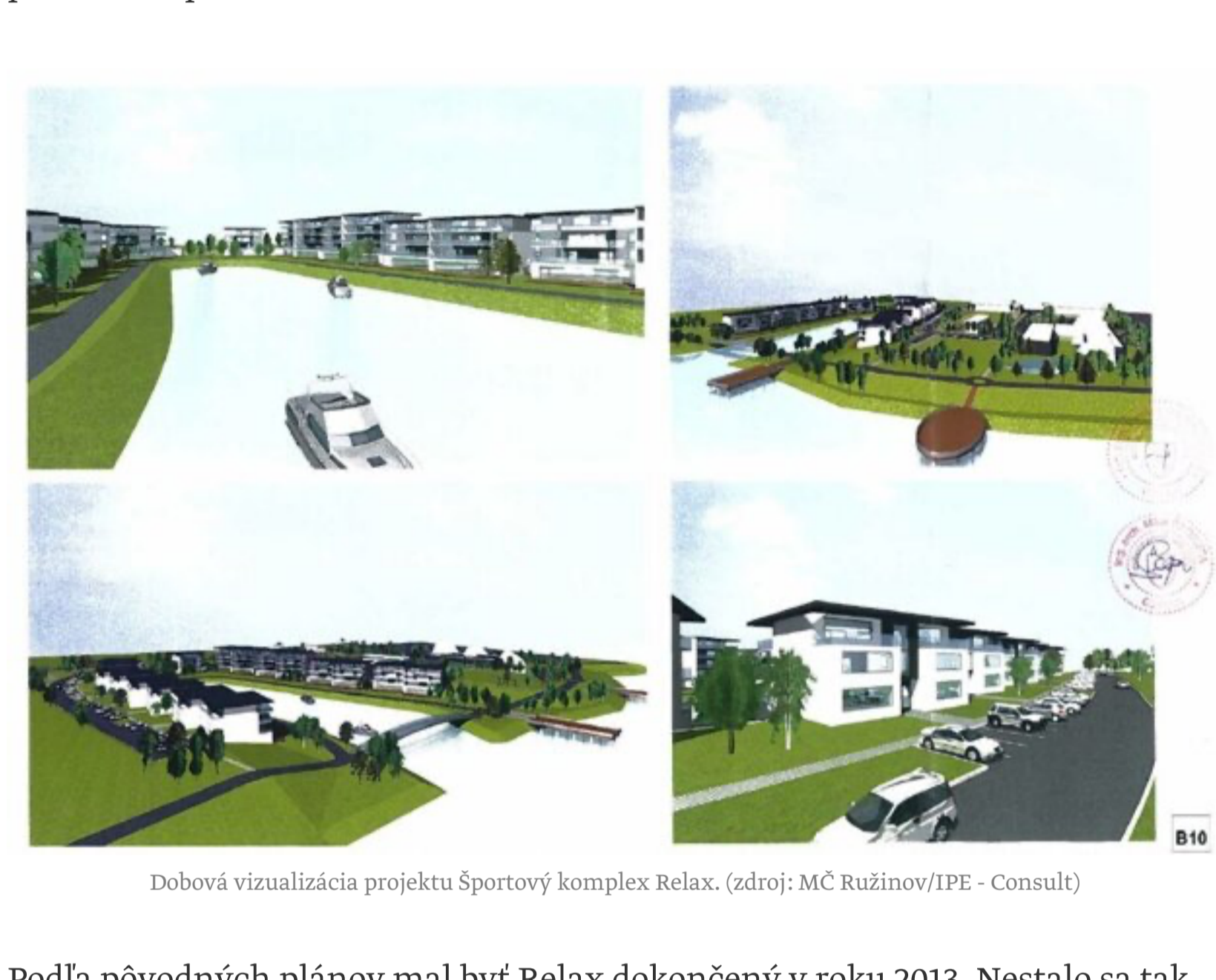
Dobová vizualizácia projektu Športový komplex Relax. (zdroj: MČ Ružinov/IPE - Consult)

Jeho súčasťou mal byť hotel v tvare písmena V, menšie objekty s apartmánmi, športová hala, ihriská, športoviská a zariadenia na rehabilitáciu. Projekt počítal s rozšírením vodnej plochy až ku komplexu, ktorý malo obsluhovať parkovisko pre 341 automobilov.